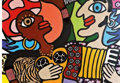
"Fiesta Sète", œuvre de Georgette.

Peintresse depuis 30 ans, autodidacte, j'ai commencé par le collage, puis avec différents supports (toile, bois, fresque), j'ai réalisé une série proche de l'Art Brut. Puis le côté sombre s'est transformé en positif, comme si la vie devait être un rêve permanent. Le confinement a été vécu comme un véritable enfermement ! J'ai alors réalisé 3 toiles "L'avant - le pendant - et l'après". Je continue à peindre avec une détermination encore plus présente, même si je suis consciente que ce ne sera plus comme avant ! La liberté a été remplacée par la répression, l'amour par l'individualisme, la solitude. Les différences par le non-respect et les inégalités. Seuls les symboles représentent l'espérance, la force de l'univers tout entier, profond puissant et spirituel !