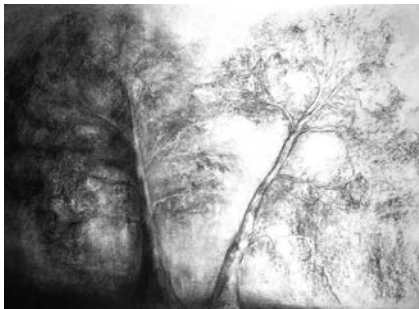
Traversées, les forêts de l'exil... fusain, pierre noire, craie blanche, 70/100 cm, 2020 © Isabelle PALATICKY.