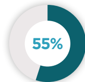
Consultation non centrée-patient